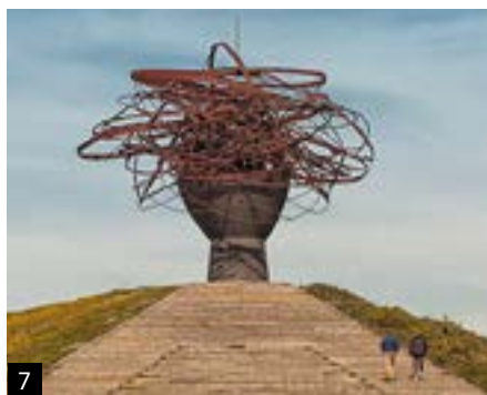
5. Silo de Hortaleza. 6. Mercado de Maravillas. 7. La Dama de Manzanares.