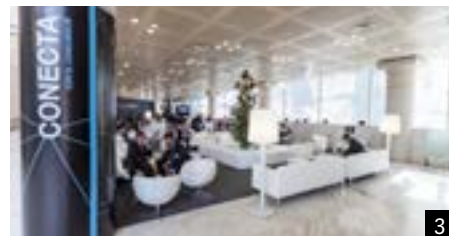
1. Estand de Madrid en Fitur. 2. Caja Mágica. 3. Un evento en el Palacio Municipal de Congresos. 4. Instalaciones de IFEMA en el Campo de las Naciones.

Madrid se ha consolidado como un foro de intercambio económico y de nuevas tendencias, un escenario cómodo, seguro y, sobre todo, acogedor, idóneo para hacer negocios. Profesionales de todo el mundo confían en Madrid para presentar sus trabajos y progresar en su carrera mientras disfrutaban del particular estilo de vida madrileño y participan de la vida cultural de la ciudad