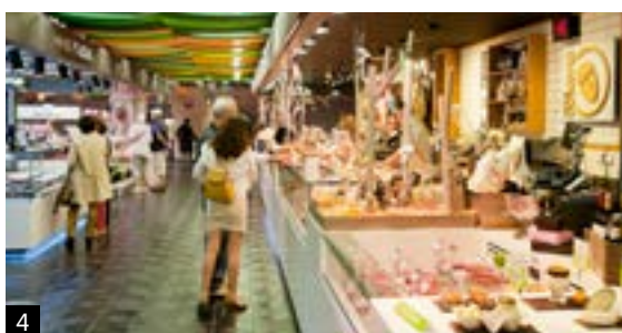
1. Panorámica desde la terraza del Círculo de Bellas Artes. 2. Terraza y piscina del Hotel Emperador. 3. Vista del Palacio Real desde una de las terrazas de la zona. 4. Mercado de San Antón. 5. Cuatro Torres Business Area. 6. Estadio del Atlético de Madrid, Wanda Metropolitano. 7. Madrid dispone de numerosos establecimientos especializados en mixología.