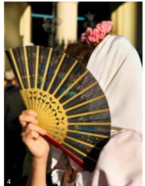
1. Fiestas de la Virgen de la Paloma. 2. Uno de los eventos organizados por Gastrofestival Madrid. 3. Días de carnaval. 4. Chulapa con abanico.