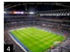
1. Madrid desde el Cerro del Tío Pío. 2. Vista aérea del Madrid de los Austrias. 3. La Colonia de la Prensa, en el barrio de Carabanchel. 4. Estadio Santiago Bernabéu.