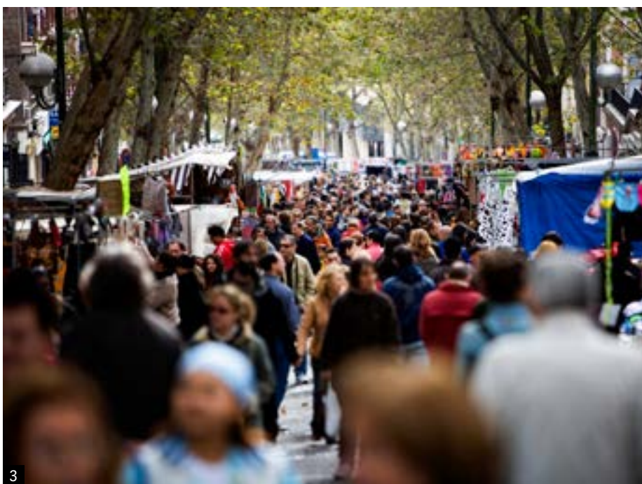
1. La comercial calle Preciados.