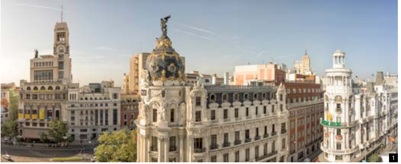
1. Panorámica con el edificio Metrópoli en primer plano.